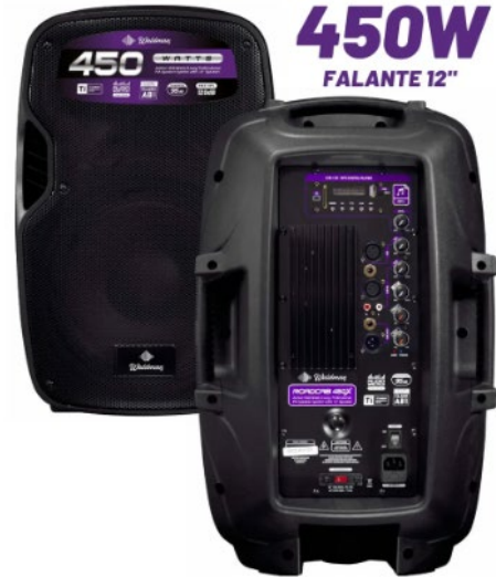
Par de caixas de 12 polegadas