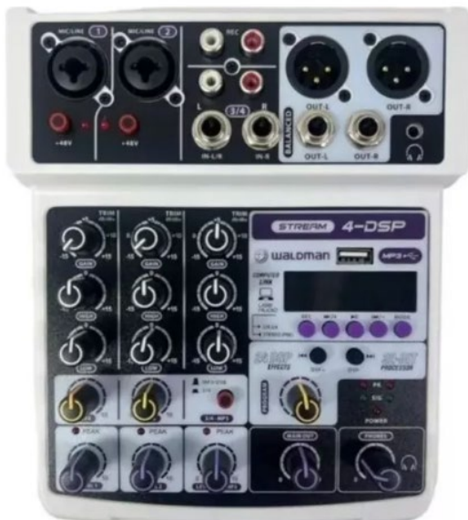
Mesa de som para Streaming