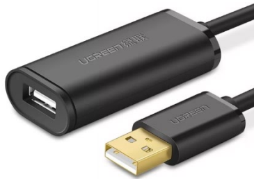
Cabo extensor USB