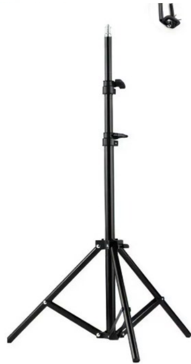
Tripé 2,1m altura