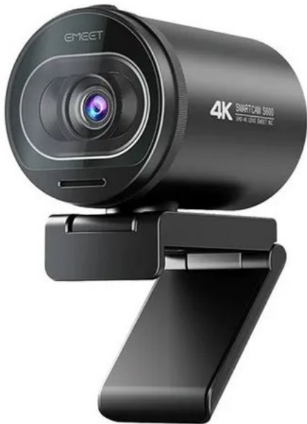
Câmera 4K com 8mp de resolução