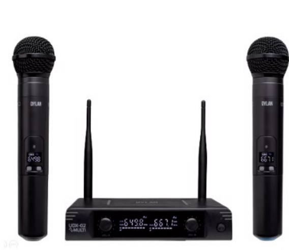
Microfone Dylan com Receptor