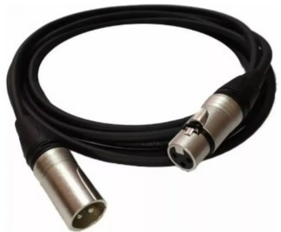
Cabo XLR Balanceado 20m